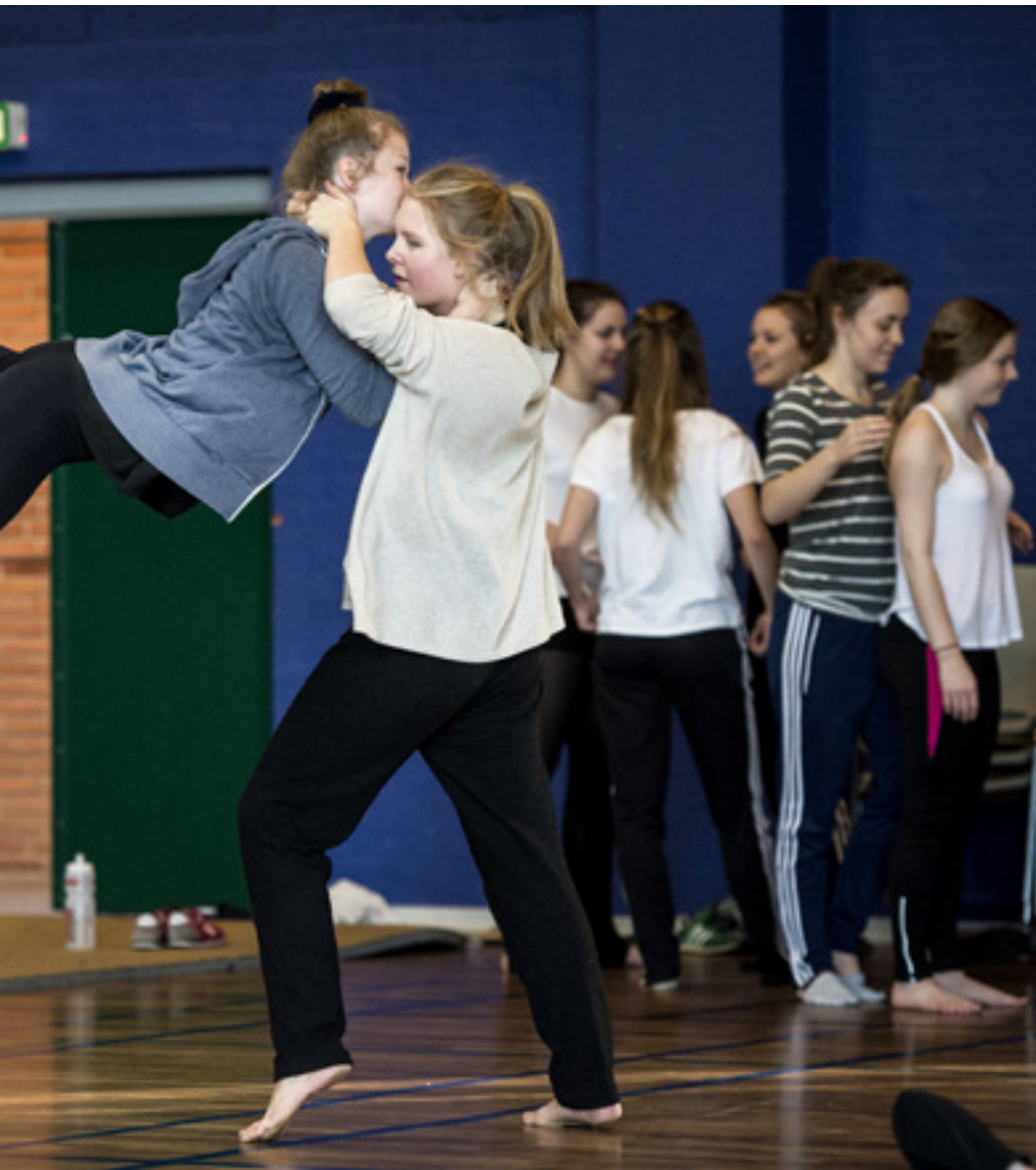
■ Viby Efterskoles elever arbejder næsten i døgn drift hele januar for at få opsætningen af musicalen "The Wiz" til at blive perfekt.